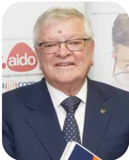
IN COPERTINA